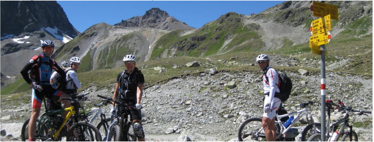
Suvretta Loop

➤ 10.00 Uhr Abfahrt vor der Bikegarage Hotel Lac Salin Den ersten Teil unserer Tour shuttleln wir auf den Bernina Pass. Über traumhafte Wälder und Pfade geht's dann abwärts nach St. Moritz, Schweiz. Von dort erfolgt der erste Teil des Aufstiegs zum Suvretta Pass mit der Corviglia Bergbahn auf 2500 Höhenmeter. Auf den restlichen 250 Höhenmetern erwarten uns ein paar steile Rampen, an deren Ende wir aber die unglaubliche Berglandschaft des Engadins bewundern können. Jetzt geht es auf einem Trail sanft rauf und runter hin zum Suvretta Pass.