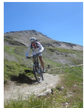
Fotos: LadyBike - Suvretta Loop

Hier erreichen wir den Einstieg in das wildromatische Val Bever mit seinen technischen Leckerbissen, sanft abfallenden Trails, mit kleineren Absätzen, Hindernissen, ganz viel Serpentinaen, kleinen Holzbrückchen etc. Für die passende Fahrtechnik sorgen wir. Ab dem Städtchen Bever rollen wir über St. Moritz zurück nach Pontresina. Dort sammelt uns der Shuttle auf zurück nach Livigno.