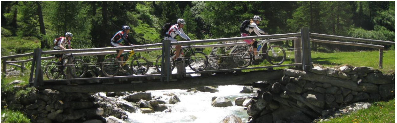
Suvretta Loop